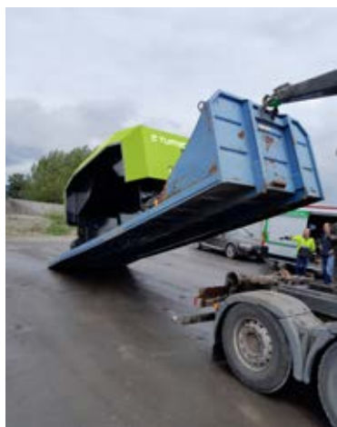
Facilità di trasporto