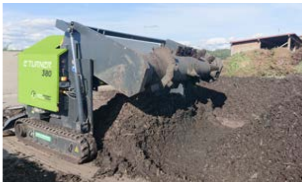
Rotore orientabile fino a 90°