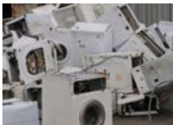
GRANDI ELETTRODOMESTICI NON FREDDI (esclusa la refrigerazione)