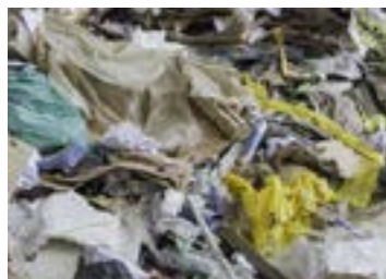
RIRIFIUTI INDUSTRIALI COMUNI