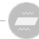
TAVOLE DI SETACCIATURA